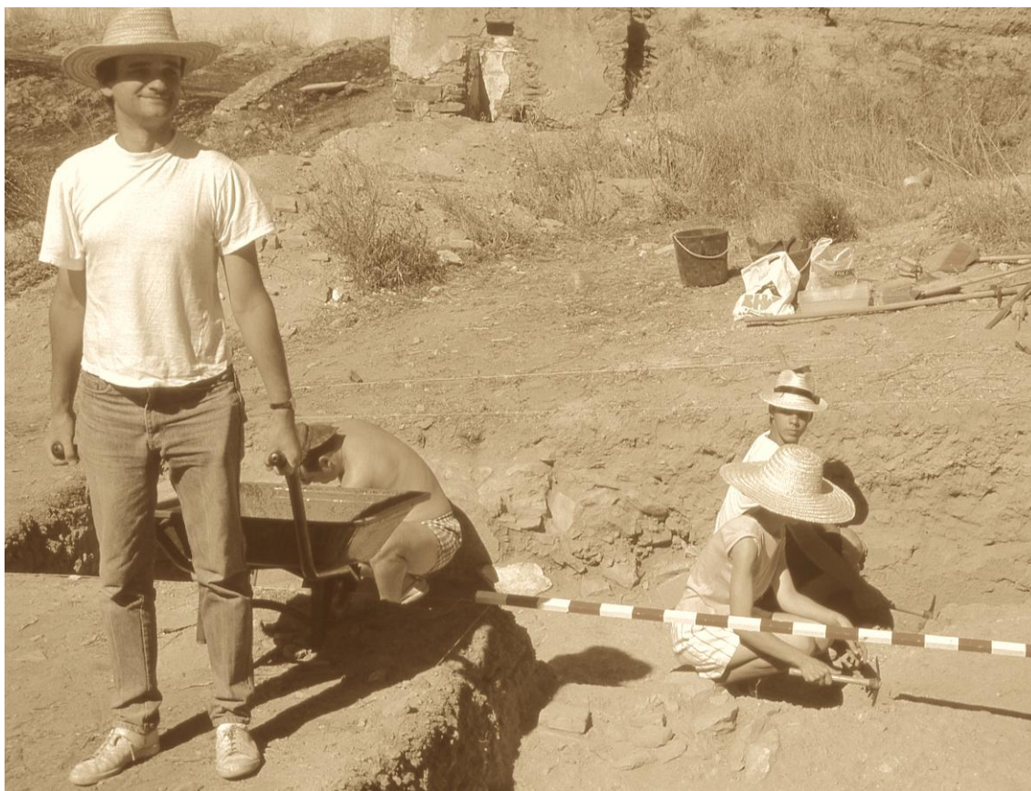
Christophe Picard nas escavações arqueológicas de Juromenha, 1988. Foto F. B. C.

Christophe Picard (1954-2024) é um nome incontornável na história do período islâmico medieval em território português. Partiu a 1 de junho de 2024 e deixou em Portugal amigos e admiradores, nomeadamente entre os investigadores de história e de arqueologia.