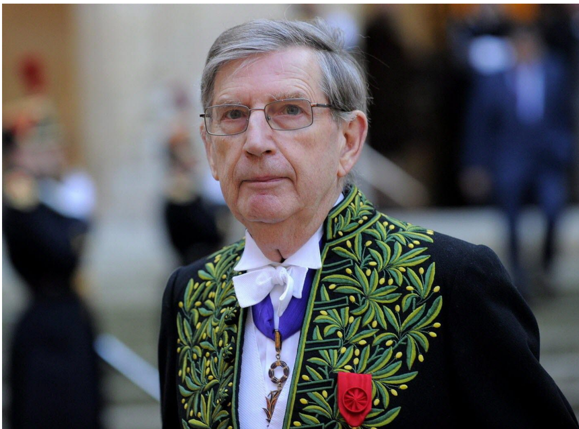
Philippe Contamine, chegando a uma sessão solene do Institut de France / Académie Française (2010).